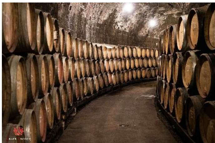
Namur – Cave d'élevage dans un tunnel du tramway 7

C'est dans deux de ces tunnels désaffectés qu'ont été aménagées les caves d'élevage du vin.