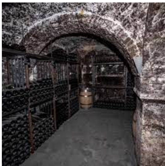
Namur – Caves de conservation sous la cathédrale

À la fin de cette première visite, nous avons repris les voitures pour rejoindre les caves de conservation situées sous la cathédrale Saint-Aubain et le Palais de justice (500 mètres de couloirs). Celles-ci se sont révélées être un véritable labyrinthe au sein duquel il est possible de trouver de nombreuses variétés de vins émanant de différents terroirs français dans une gamme de prix à large spectre.